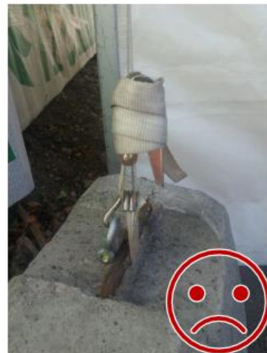
Kuva 8. Sakkeli löytyy, mutta tätä ei ole käytetty kiinnitykseen. Koukku irtoaa rakenteen jousaessa.