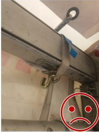
Kuva 9. Kuormaliina leikkaantuu kiristyessään.