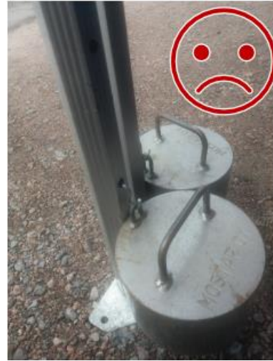
Kuva 10. Painojen teräskoukku ei ole lukittu. Teräs leikkaa alumiinia, jolloin kiinnitys ei ole toimiva.