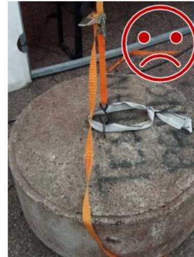
Kuva 12. S-koukku irtoaa rakenteen jousaessa tulessa. Kiinnitystä ei ole lukittu kiinnityspisteeseen.