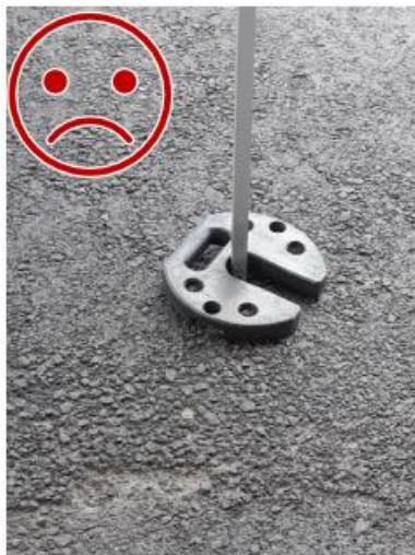
Kuva 7. Toinen vastaava paino puuttuu vastapuolelta sekä näiden lukitseminen toisiinsa, jolloin lukkiutuisi myös tolppaan. Kolojen yhteen sopiminen painovoimaisesti ei ole lukitseva.