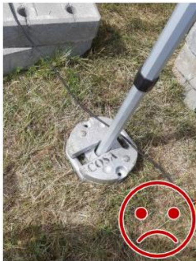
Kuva 3. Vastapainojen lukitus toisiinsa puuttuu. Tässä toteutuu ainoastaan painovoimainen kiinnitys toisiinsa.