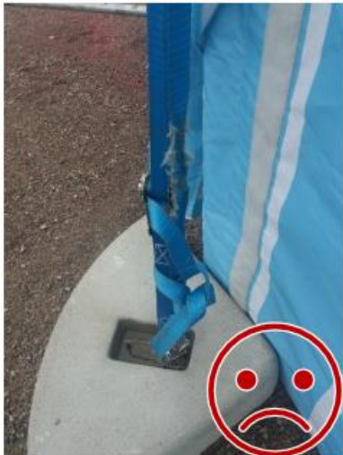
Kuva 11. Kuormaliina on kulunut