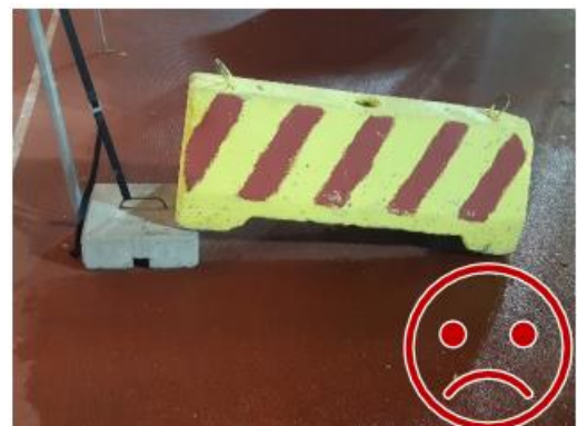
Kuva 4. Kuormallinen kitkalukko on heikko. Pienempi paino saattaa liikkua, jolloin suurempi paino putoaa aiheuttaen vaaraa.