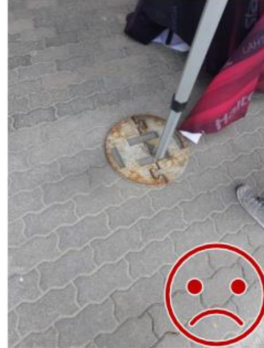
Kuva 2. Tolpan painolevy on liian pieni ja yhteensopimaton painon kanssa. Lisäksi tästä puuttuu toinen samanlainen paino poikittain lukitsemasta alemmaa painoa paikoilleen.